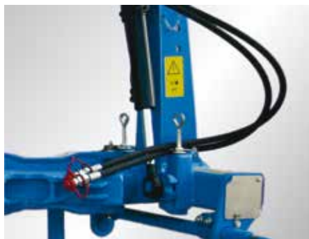
Надежный оборотный механизм

Все навесные плуги компании LEMKEN снабжены усовершенствованным гидравлическим оборотным механизмом